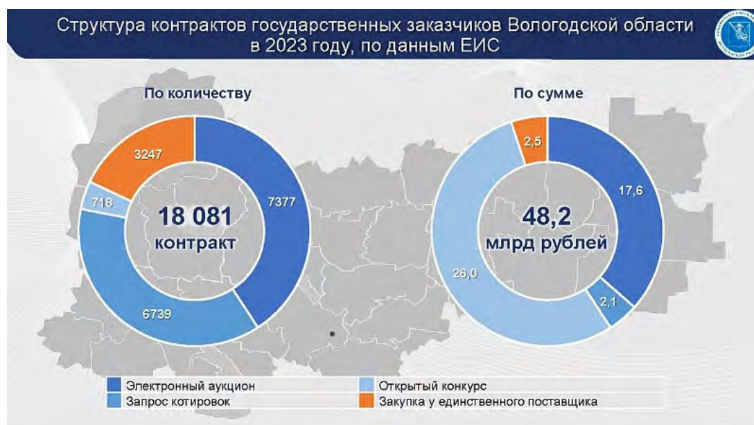
Рисунок. Структура контрактов государственных заказчиков Вологодской области

Также ежегодно мы обобщаем результаты деятельности в ходе экспертно-аналитического мероприятия «Анализ результатов аудита в сфере закупок». При этом систематизируем итоги работы контрольных органов и оцениваем результаты закупок на территории региона.